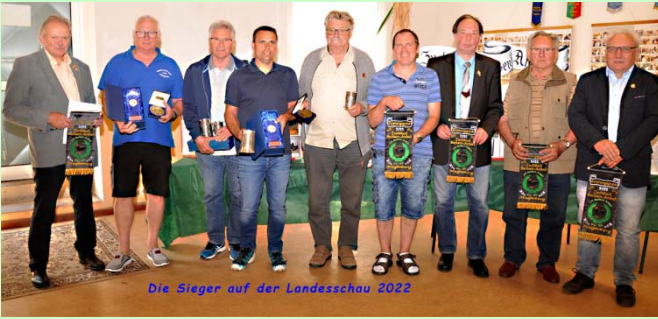
Die Sieger auf der Landesschau 2022

Zur Landesschau 2022 stellten sie ihre Tiere vor-es hat sich gelohnt