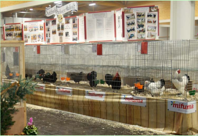
MIRAMA Magdeburg 2022

Zur Landesschau 2022 stellten sie ihre Tiere vor-es hat sich gelohnt